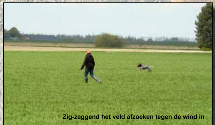
Zig-zaggend het veld afzoeken tegen de wind in