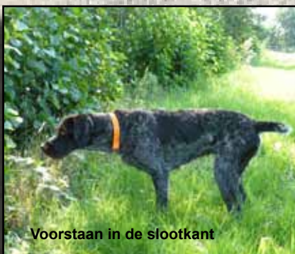
Voorstaan in de slootkant

Er wordt nadrukkelijk aangeraden uitsluitend te trainen op natuurlijk wild. Gekooid wild gedraagt zich anders en de hond zal na een aantal ervaringen met gekooid wild dit niet meer willen voorstaan.